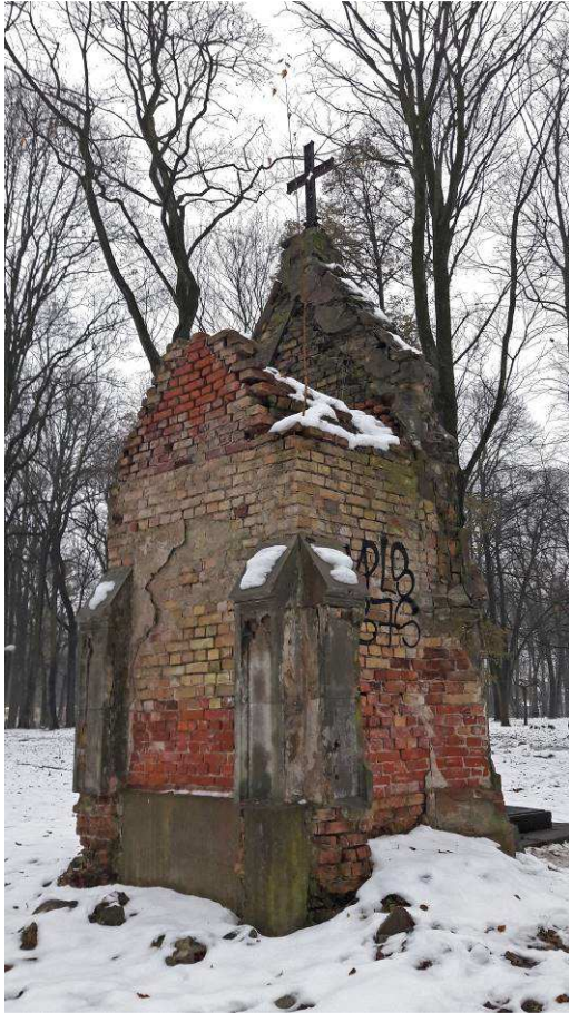
4. attēls. Kroger dzimtas kapliča, skats pa diagonāli no aizmugures, 2016. gads.