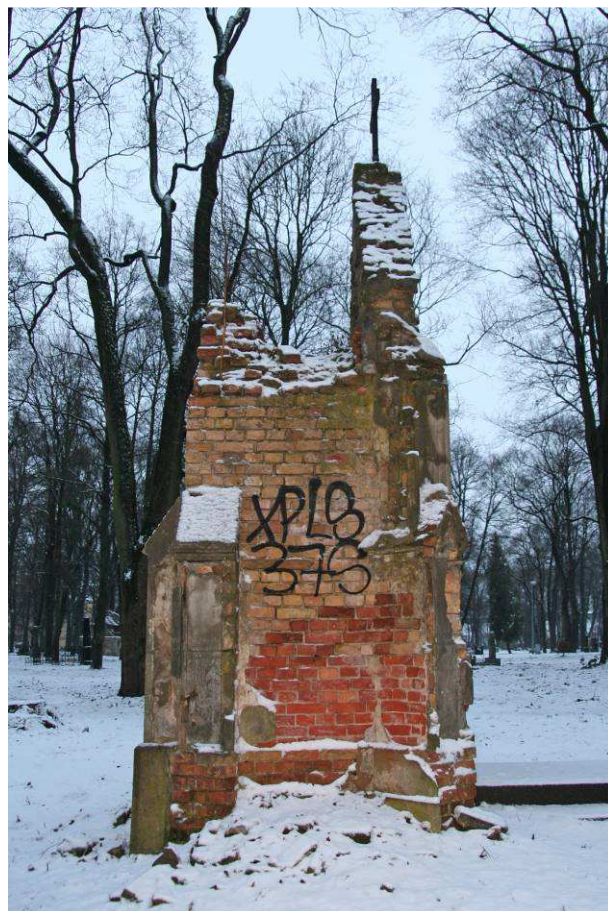
3. attēls. Kroger dzimtas kapliča, kreisais sānskats, 2016. gads.