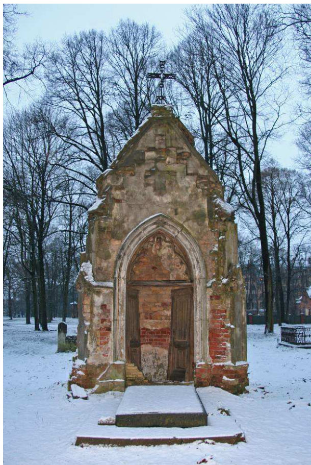
2. attēls. Kroger dzimtas kapliča, pretskats, 2016. gads.

Kapličas šahta pastāvīgi tiek piegrūžota ar sadzīves atkritumiem. Kapličas virsmu visā apjomā klāj aļģes.