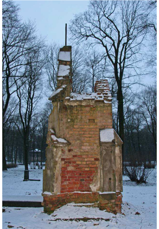
5. attēls. Kroger dzimtas kapliča, labais sānskats, 2016. gads.